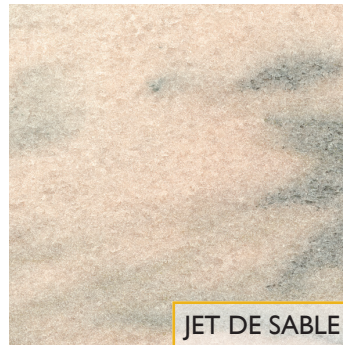
JET DE SABLE