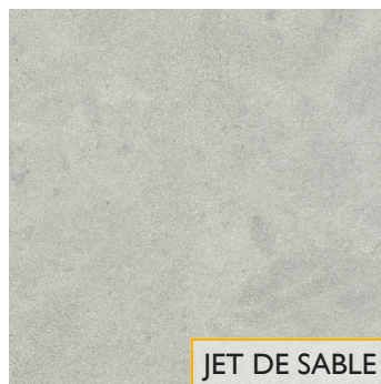
JET DE SABLE