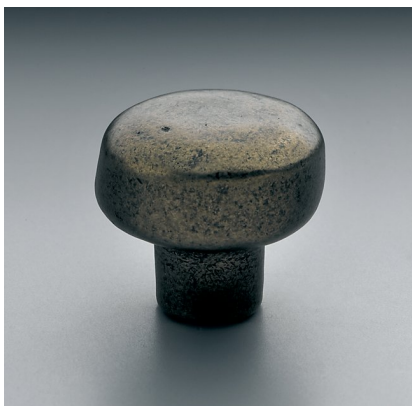
POIGNÉE RONDE DAKOTA Restoration Hardware