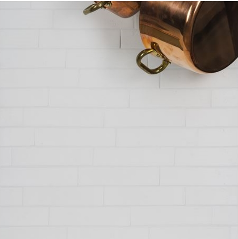
CARRELAGE MURAL MURO41 MILK, 2" x 9" Ceragres