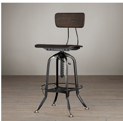
TABOURET VINTAGE TOLEDO, FINI EN FER Restoration Hardware