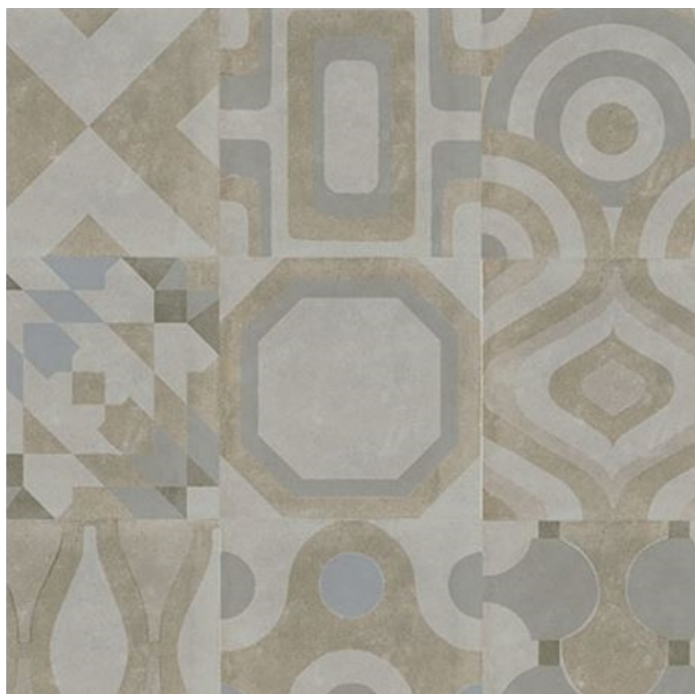
CARREAU DE SOL MEMORY IN BLANC DÉCOR, 8" x 8" Ceragres