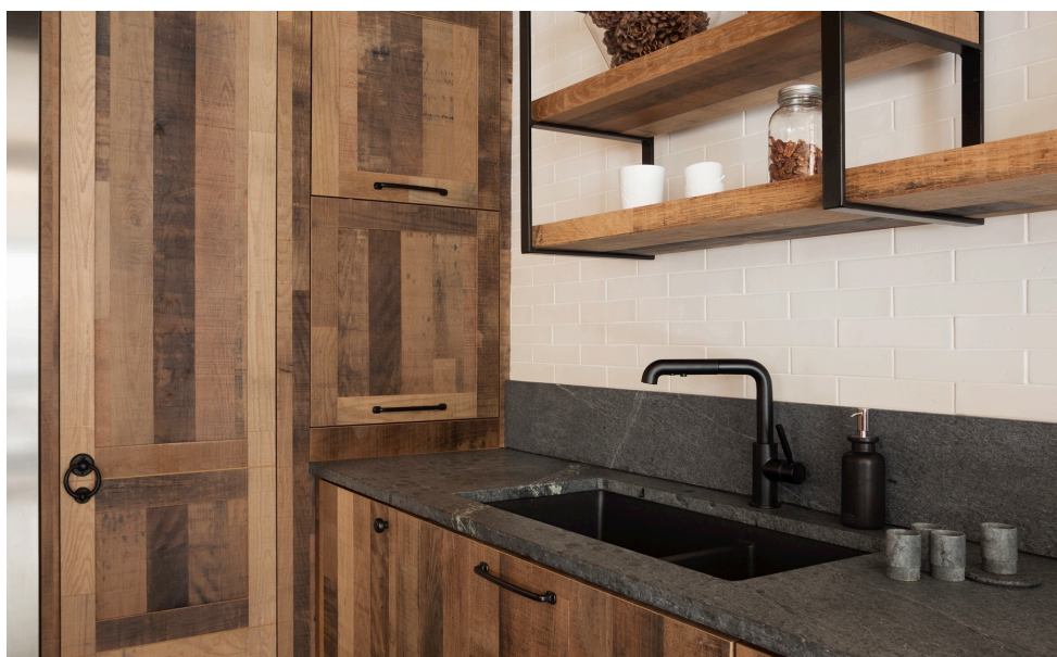
ÉBÉNISTE Armoires Simard