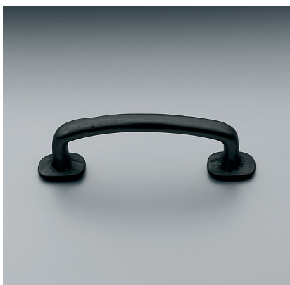
POIGNÉE DAKOTA EN FER DOUX Restoration Hardware