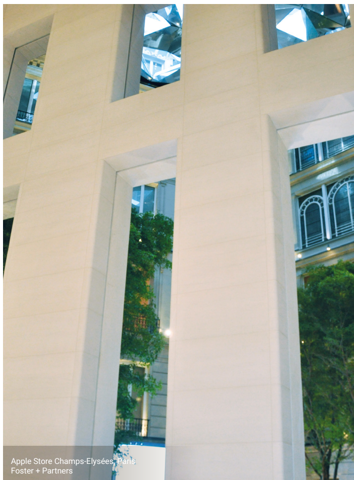
Apple Store Champs-Élysées, Paris Foster + Partners